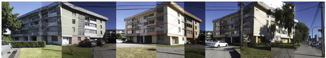
Fig. 5 Levantamiento Fachada Sur del Área Central

El índice de calidad del espacio público, entrega antecedentes complementarios al análisis cuantitativo, ya que evalúa distintos aspectos relacionados con la percepción del espacio, para identificar su efectividad dentro de la generación de áreas de convivencia.