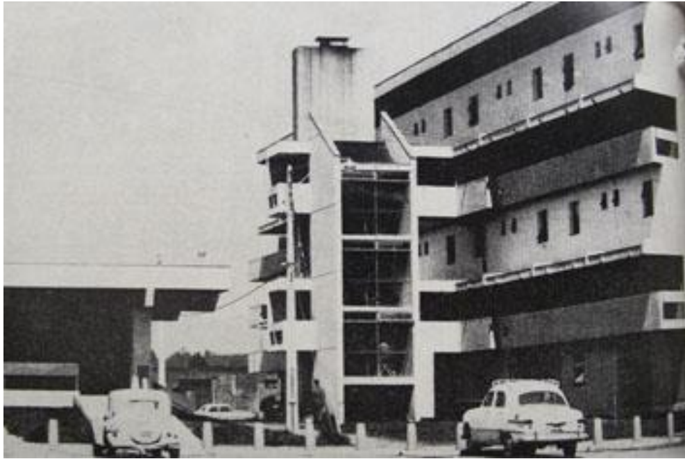
Fig. 2 Remodelación Paicaví

Dentro de la trama de la remodelación, se identifican 3 espacios públicos de mayor jerarquía, con respecto a las áreas de circulación con jardines y pequeñas áreas verdes, siendo el espacio central, el cual en su afán integrador de actos comunitarios, albergaba desde el diseño original un área comercial en el centro, que organiza 4 plantas las cuales se abren en todas las direcciones en las periferias del volumen que se conectan a través de un pasillo perimetral cubierto por la proyección de los aleros del volumen.