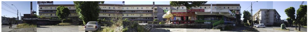
Fig. 4 Levantamiento Fachada Norte del Área Central