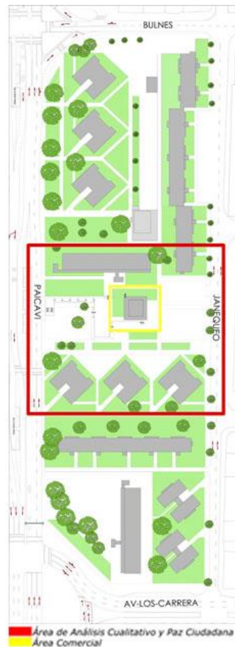
Fig. 3 Planta Estado Actual Remodelación Paicaví Fuente: Elaboración propia